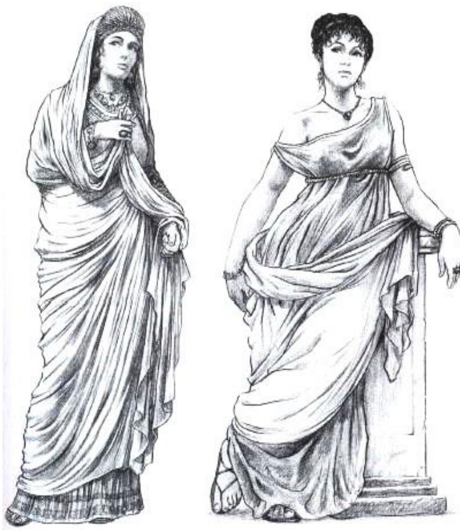
Таблица 1. Анализ костюма Древнего мира