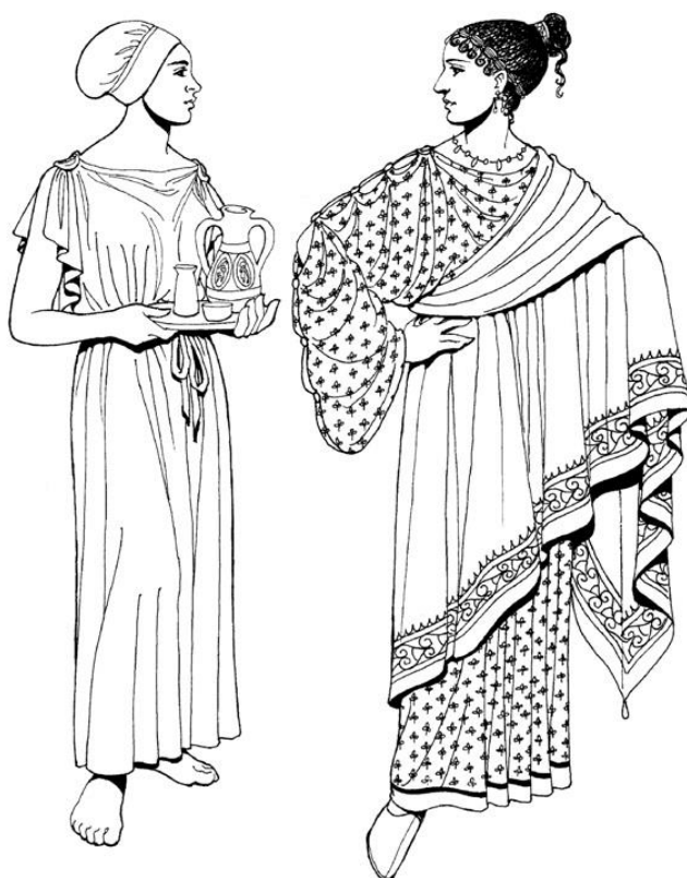
Таблица 1. Анализ костюма Древнего мира