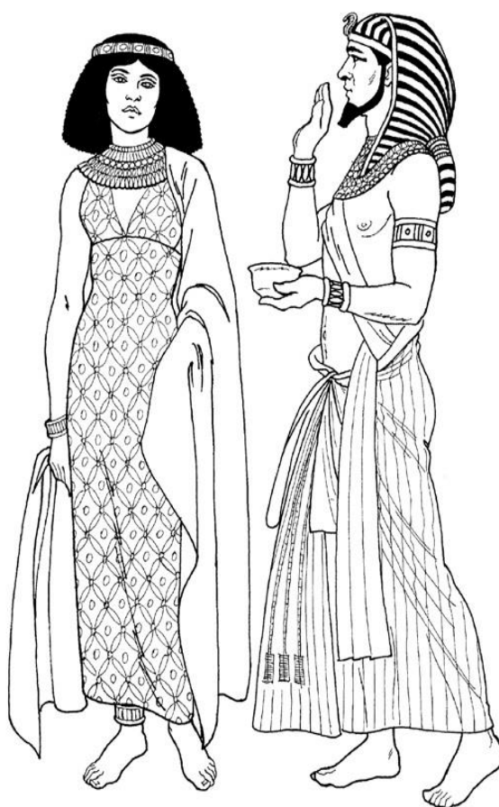
Таблица 1. Анализ костюма Древнего мира