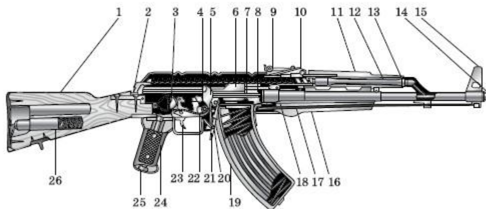
Рис. 10. Устройство автомата: 1 – приклад; 2 – выступ направляющего стержня возвратного механизма; 3 – переводчик; 4 – крышка ствольной коробки; 5 – курок; 6 – затворная рама; 7 – ударник; 8 – затвор; 9 – прицельная планка; 10 – колодка прицела; 11 – ствольная накладка; 12 – газовый поршень; 13 – газовая трубка; 14 – муфта ствола; 15 – основание мушки; 16 – цевье; 17 – шомпол; 18 – ствол; 19 – магазин; 20 – защелка магазина; 21 – боевая пружина; 22 – рычаг автопуска; 23 – спусковой крючок; 24 – пистолетная рукоятка; 25 – соединительный винт; 26 – принадлежность

Из автомата ведется автоматический огонь или одиночный огонь. Автоматический огонь ведется короткими (до 5 выстрелов) и длинными (до 10 выстрелов) очередями и непрерывно. Подача патронов при стрельбе производится из коробчатого магазина емкостью на 30 патронов.