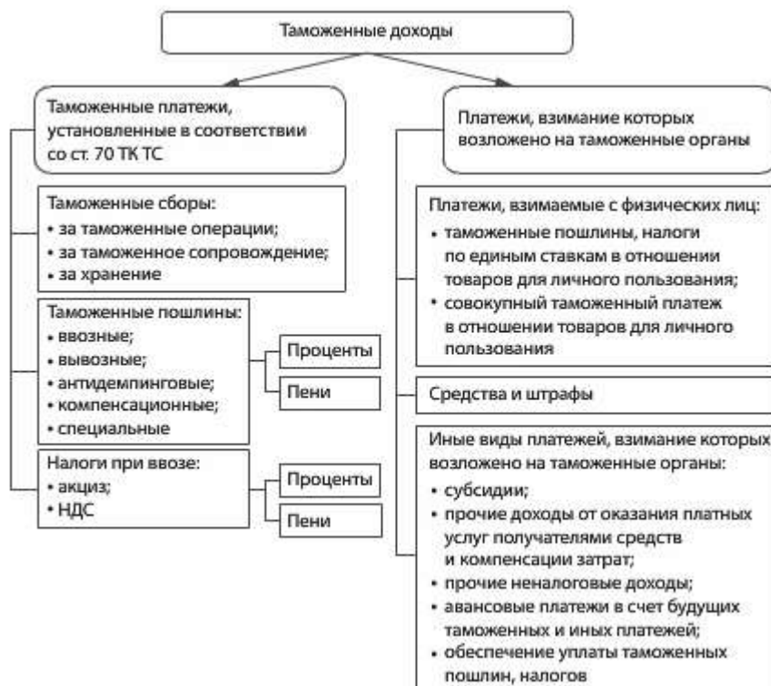
Рис. 2. Классификация таможенных доходов в 2016 г.

В отличие от ввозной таможенной пошлины целями взимания вывозной таможенной пошлины являются: – сдерживание вывоза товаров, необходимых для благоприятного и безопасного функционирования национальной экономики; – снижение вывоза за пределы страны сырьевых товаров с целью развития и модернизации внутреннего производства. Классификация платежей, формирующих таможенные доходы, представлена на рис. 2.