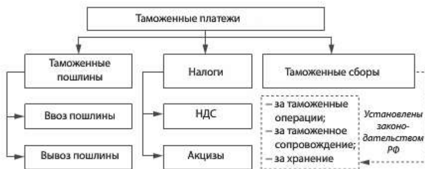
Рис. 3. Виды таможенных платежей в ЕАЭС.

Специальные, антидемпинговые и компенсационные пошлины устанавливаются в соответствии с международными договорами государств – членов ЕАЭС и взимаются в порядке, предусмотренном ТК ЕАЭС для взимания ввозной таможенной пошлины. Состав таможенных платежей в ЕАЭС представлен на рис. 3.