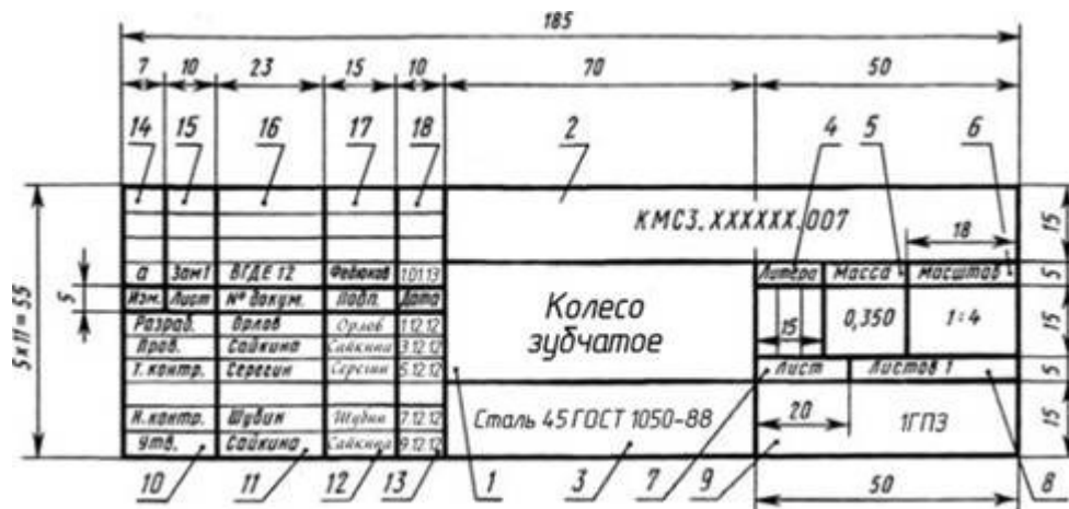
Рисунок 1 Основная надпись производственного чертежа

При заполнении основной надписи в графе 1 указывают наименование изделия. Запись ведется в именительном падеже единственного числа. Если название состоит из двух слов и более, то первое слово должно быть именем существительным, например: "Колесо зубчатое".