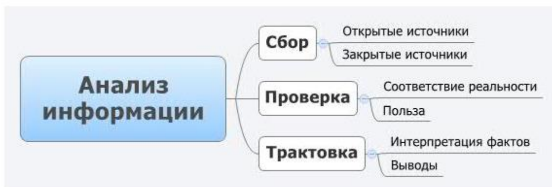
Рис 1. Анализ информации.

В какой бы сфере вы не занимались сбором и анализом информации (от научной сферы до сферы продаж), вам необходимо придерживаться заданной последовательности: сначала собираем, потом проверяем, потом трактуем информацию.