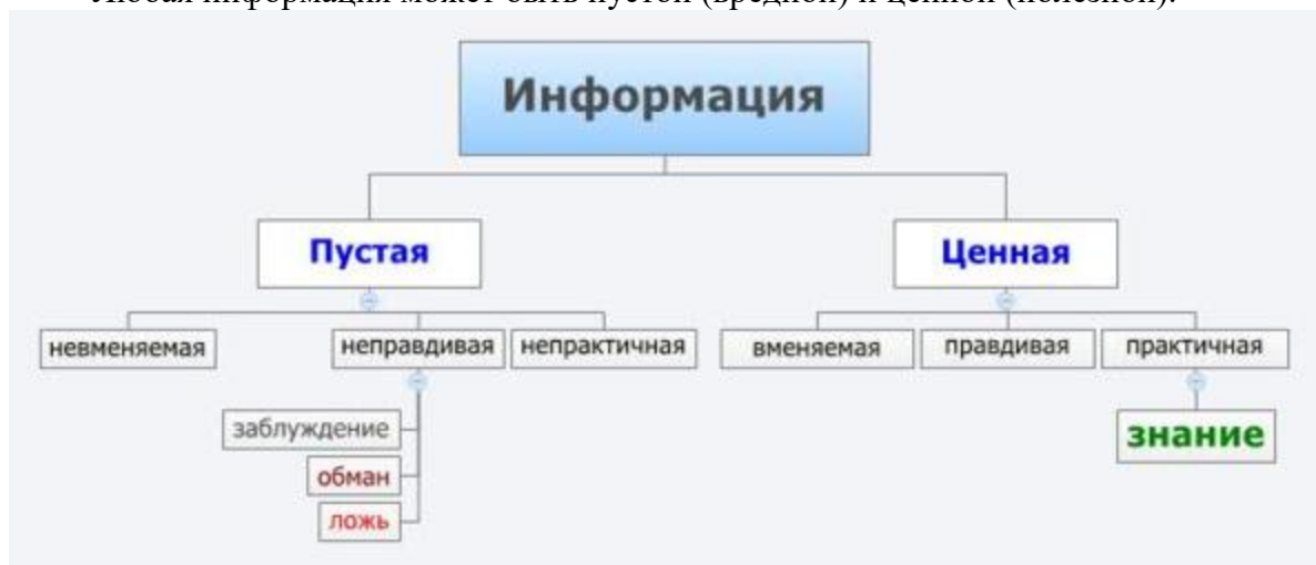
Рис 2. Разновидности информации.

Любая информация может быть пустой (вредной) и ценной (полезной).