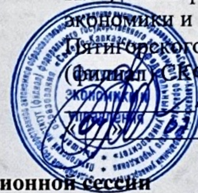
График пересдач по итогам летней зачетно-экзаменационной сессии факультета экономики и управления 2023-2024 учебного года (очная форма обучения)